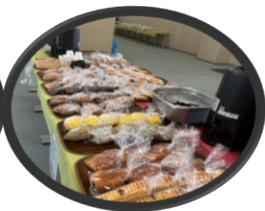
ひいらぎパン・コーヒー