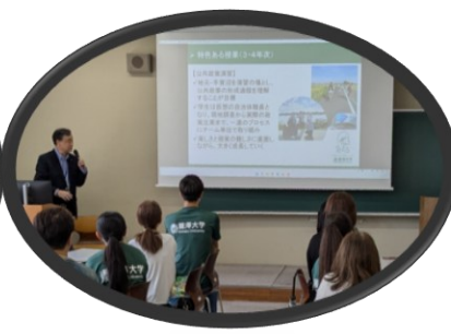
学部別懇談会の様子